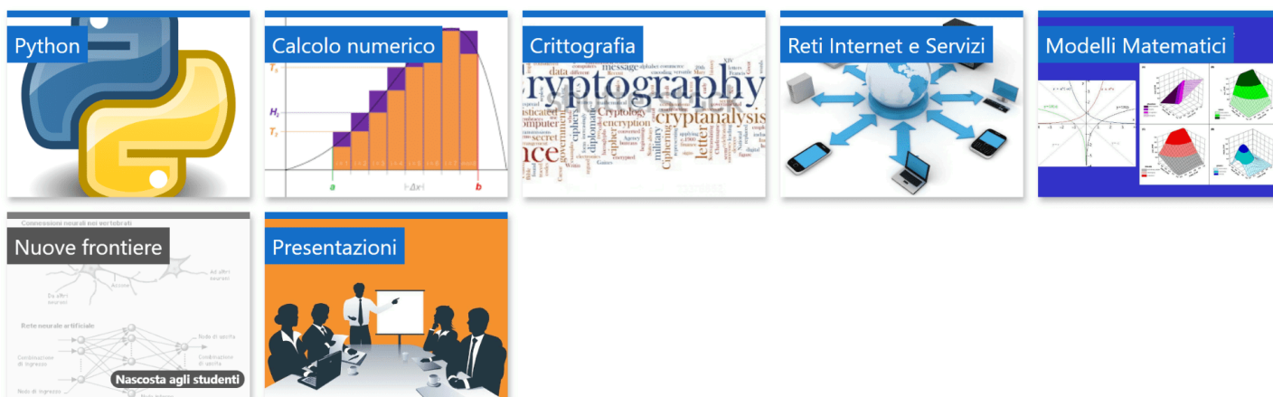
Figura 4 - Argomenti del corso per le quinte del Liceo Scientifico delle Scienze Applicate.

Ogni corso viene poi suddiviso in argomenti e che raggruppano una serie di attività ordinate in modo cronologico ( fig. 4 ).